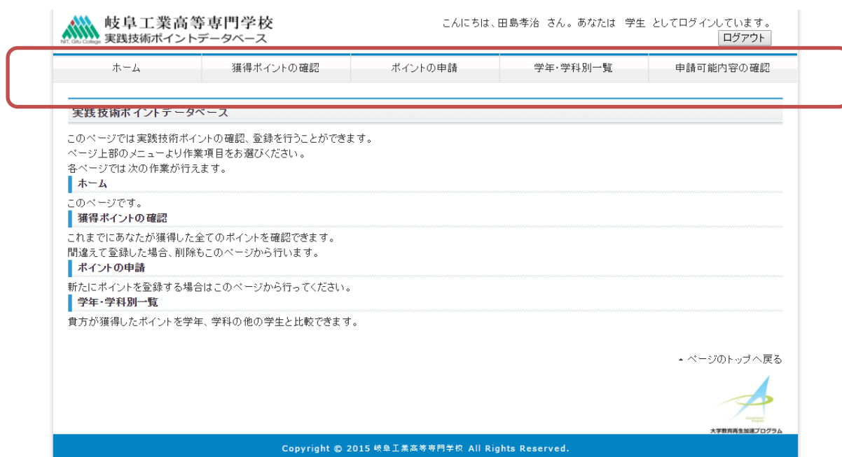
図 1.2 ホームページ

ログインに成功すると図 1.2 のような画面が表示されます。これが実践技術ポイントデータベースのホームページです。ポイントの確認や申請は上部のメニューから行います。