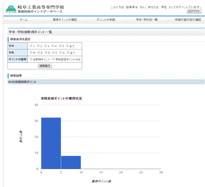
図 1.9 ポイントの獲得状況の表示（学生版）

ホームページに表示されるメニューの「学科・学年別一覧」ボタンをクリックします。その後、学年と学科名、グラフ化するポイントの種類を選択し、検索実行ボタンを押すと、図 1.9 のようなグラフが表示されます。誰が何ポイントを獲得しているかは確認できない仕様となっています。